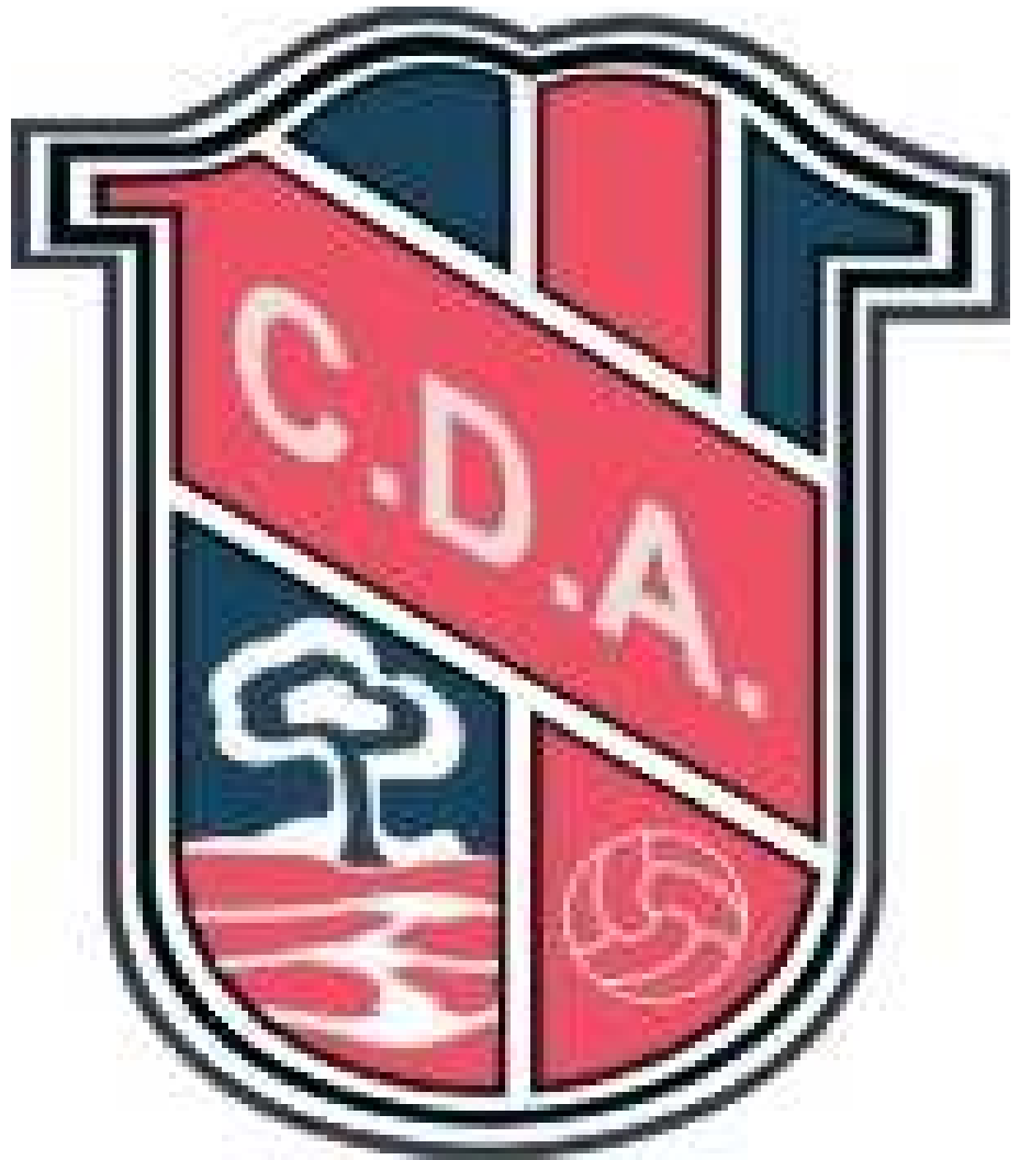
Escudo del CD Almensilla

Lo único que podemos decir de él es que tradicionalmente ha estado encuadrado en grupos cercanos a la capital. Conoce bien a los otros nuevos del grupo como el San Martín y el Villanueva, pero por aquí no los conocíamos. En las últimas temporadas, con excepción de la inmediatamente anterior ocupó puestos altos, y en la presente se ha instalado en la zona media alta con resultados discretos pero efectivos. Aunque empezó mal la temporada, perdiendo ante el San Martín y el Priorato fuera de casa y empatando ante el Minas en su propio feudo, los azulgrana consiguieron escalar algún que otro puesto gracias a las victorias cosechadas ante equipos de la zona baja como el Salteras o el Cantillana. Además, noviembre resultó fructífero para este conjunto que acumuló seis partidos sin perder, comenzando su racha, precisamente ante el Navas, y venciendo nada menos que al Villanueva. En este apartada, el Almensilla se ha convertido en un verdadero quebradero de cabeza para los “grandes” y es que en sus redes ha caído no