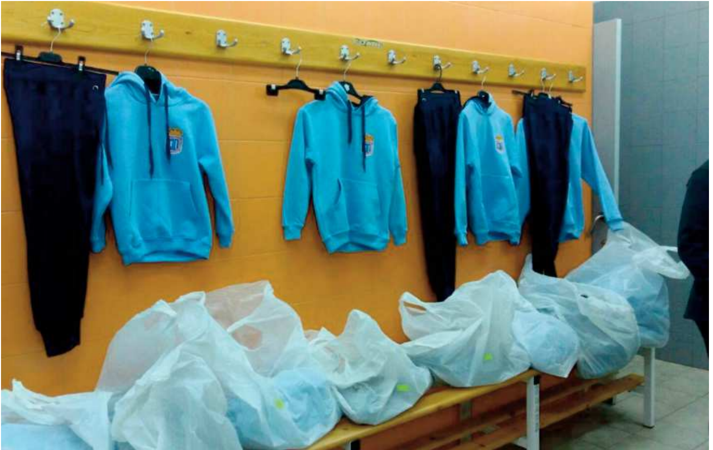
Imagen de los chandals entregados por el Ayuntamiento a la Escuela de Fútbol