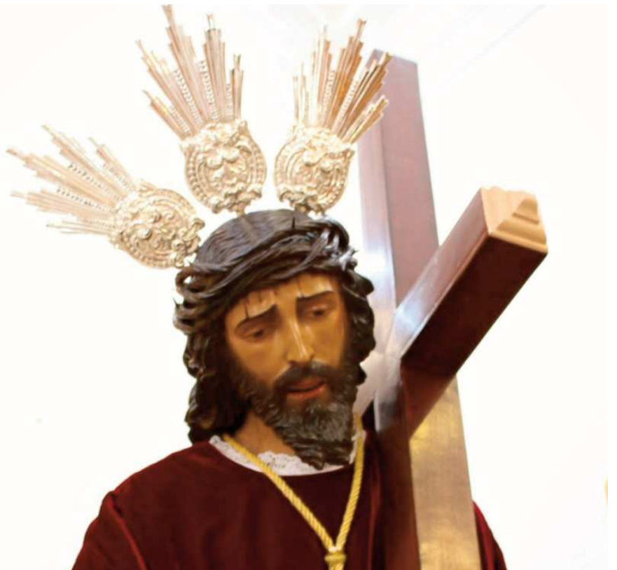
Ntro. Padre Jesús

La obra de Ntro. Padre Jesús data de 1941 y se hizo tras la destrucción del anterior en la guerra civil. Por su parte, la Virgen de los Dolores, se realizó entre los años 1942 y 1946, siendo adquirida gracias a rifas y donaciones.