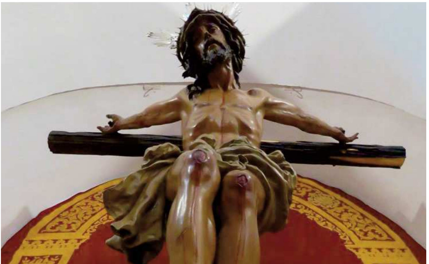
Stmo. Cristo de la Salud y Misericordia