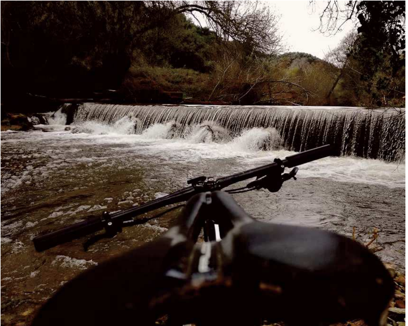
imagen de la Rivera del Ciudadeja con su caudal actual