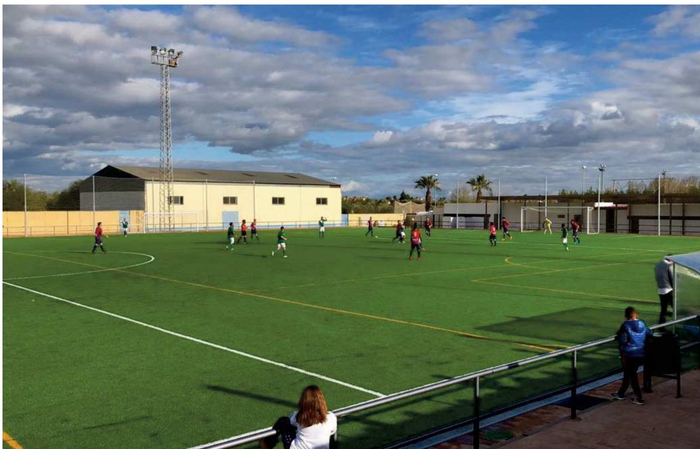
Imagen del partido del domingo en Almensilla