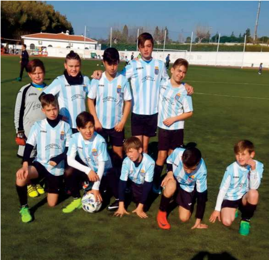
Equipo Alevín de Las Navas